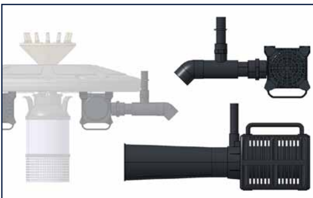
* Safe-Rain floating fountains accessory module.

El aireador sumergido está concebido para satisfacer la necesidad de todos aquellos que quieran oxigenar el agua de un estanque sin incluir los chorros de agua de una fuente flotante.