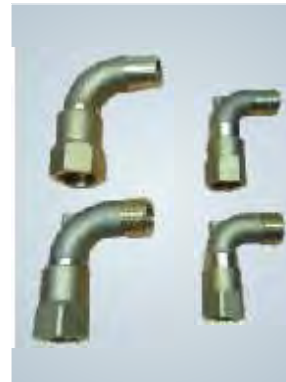
Codo giro loco / Swivel hose ell