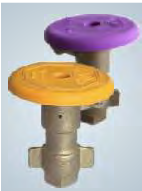
Hidrantes / Hydrants