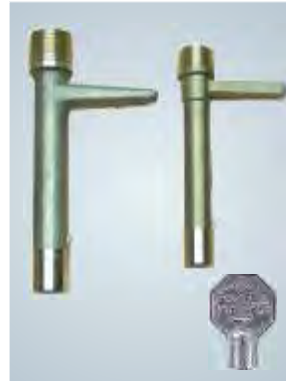
Bayonetas / Keys