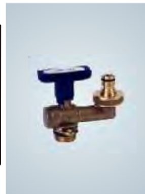
Boca de riego vertical / Vertical irrigation plug