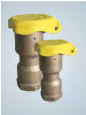
Hidrantes / Hydrants