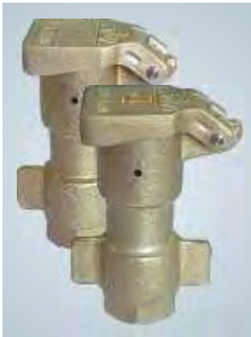
Hidrantes / Hydrants